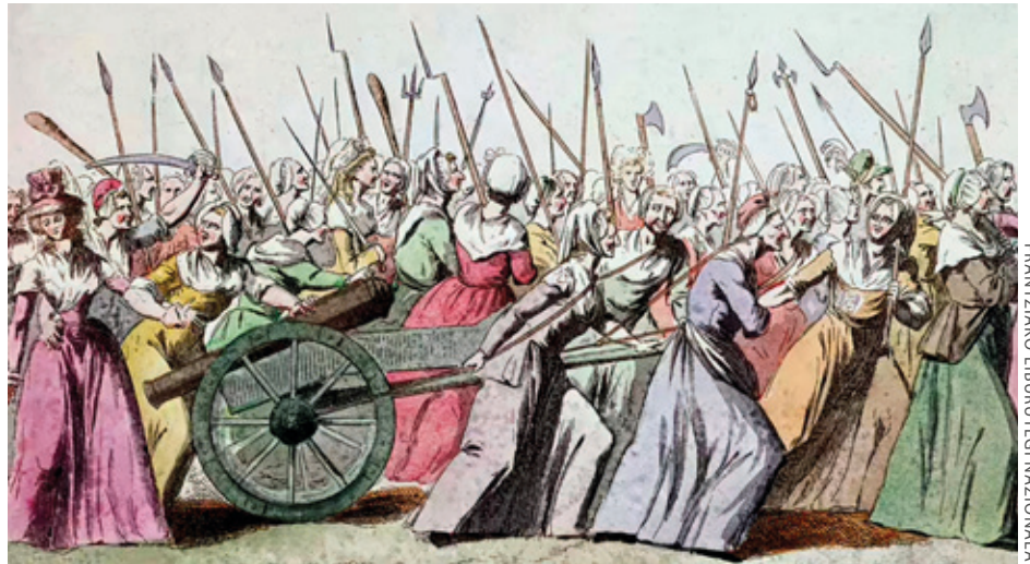
FRANTZIAKO LIBURUTEGI NAZIONALA