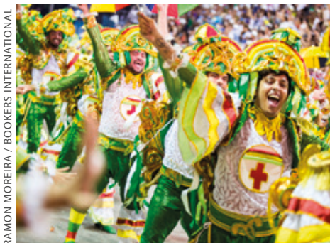
RAMON MOREIRA / BOOKERS INTERNATIONAL

tan topatu dute. Lagoa dos Patos inguruko muinoetan duela 2.300-1.200 urteko zeramika zatiak topatu dituzte, hainbat arrain errezeta arrastoekin eta tuberkuluz, artoz eta palmaz egindako edari alkoholikoekin zantzuekin. Muino horietan egiten zituzten arrain eta alkohol festak egungo inauterien jatorria liriateke, teoria berriaren arabera. ●